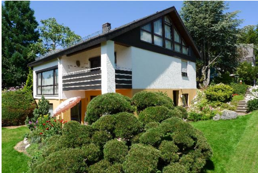
Das Haus im Sommer - die Ferienwohnung befindet sich im gelb eingefassten Bereich; davor die großzügige Spiel- und Liegewiese

Da wir nicht an einer Durchgangsstrasse liegen und der Wald im Sommer wie im Winter gepflegte Wanderwege hat, ist für Ihre Erholung und Ruhe bestens gesorgt.