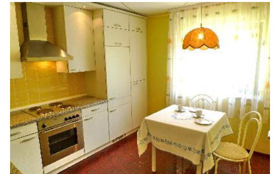
Die moderne und komplett eingerichtete Küche