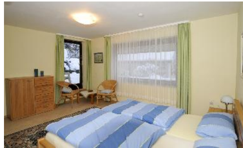
Das gemütlich eingerichtete Schlafzimmer und das modern gestaltete Wohn-Schlafzimmer

Im Winter finden Sie die Rodelwiese und Langlaufloipe unweit von unserm Haus (Skiverleih möglich); Tennisplatz in der Ortsmitte.