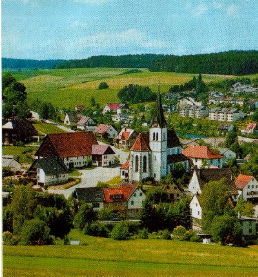
Unterkirnach im Schwarzwald (800 - 1000 m ü.M.), ein kinderfreundlicher Luftkurort